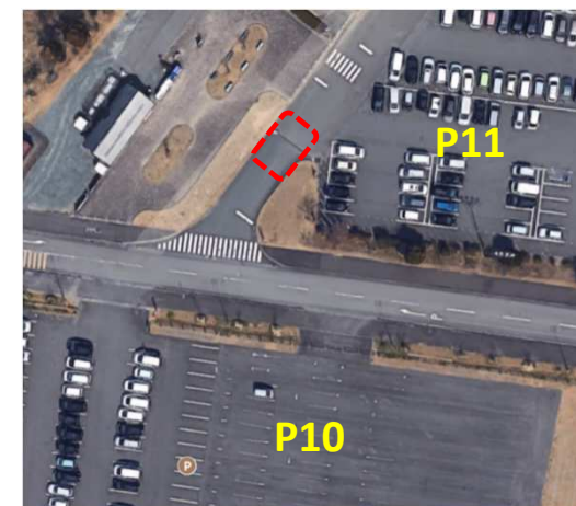
添付図 1. P11 駐車場入口付近 傾斜角詳細図