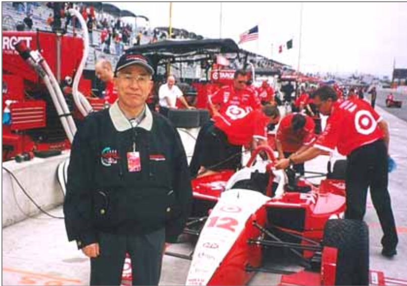
米国 CART 選手権